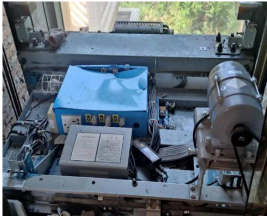
图3 电梯轿顶现场照片