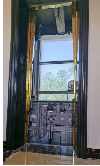
图2 五楼层门处现场图片