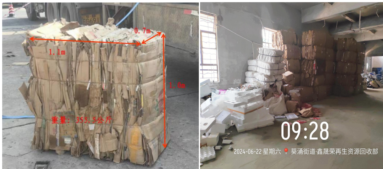
图 3 废纸皮包实物图

装载物：废纸皮包。装上平板挂车的废纸皮包尺寸约：长 110cm，宽 70cm，高 100cm，重量：355.5kg/包。其场内还堆垛有部分未来得及装车的纸皮包（图 3）。