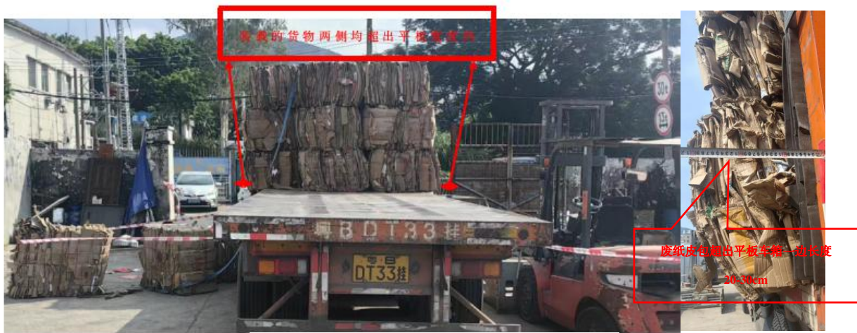
图 4 涉事平板挂车装载情况