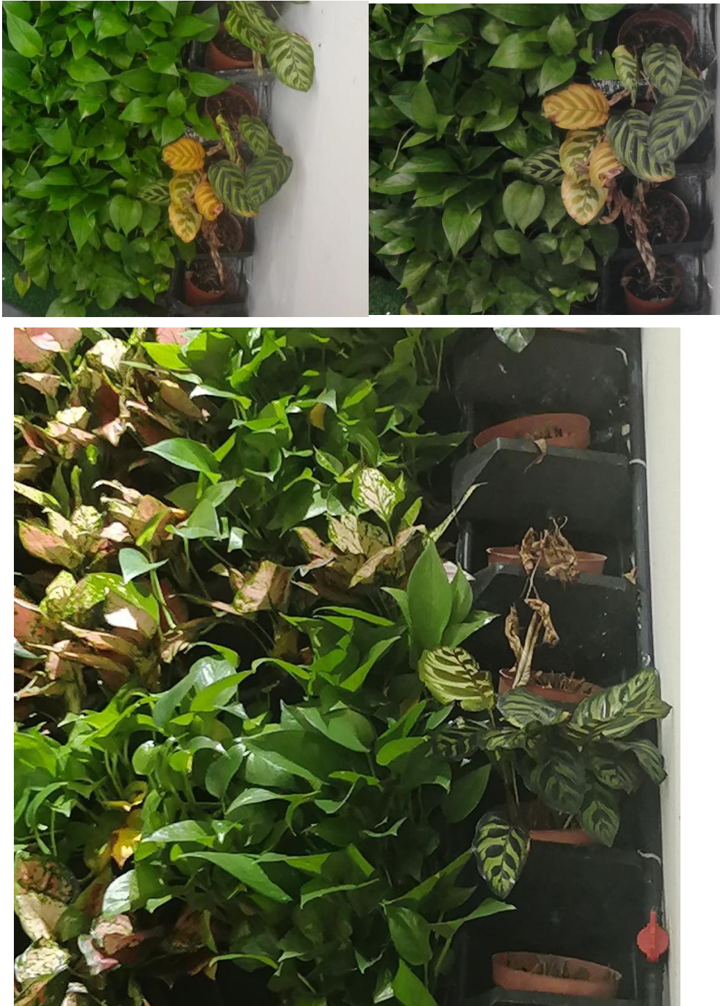
图 4-2 展厅内绿植墙枯萎，空置情况