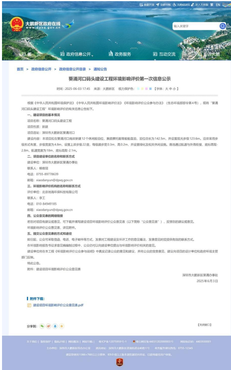
图 2.1-1 大鹏新区政府在线首次信息公示截图