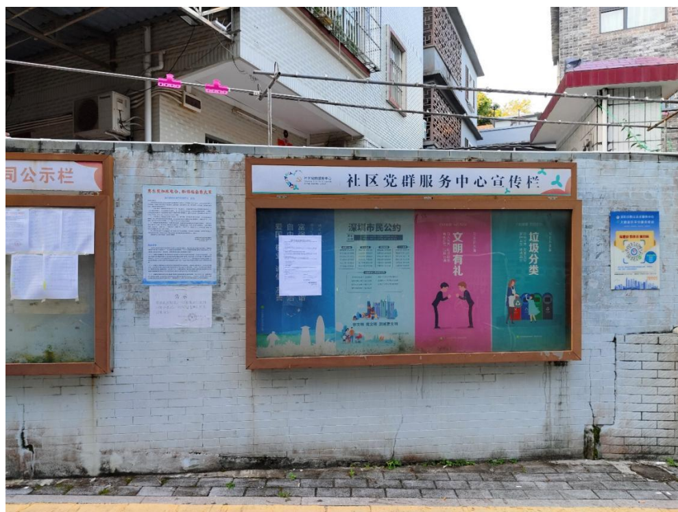
2. 沙鱼涌院区式管理小区