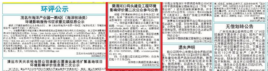
图 3.1-3 2025 年 8 月 27 日征求意见稿公示报纸截图