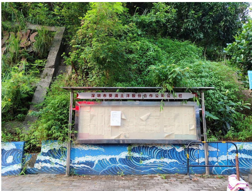
1. 大鹏新区葵涌土洋股份合作公司