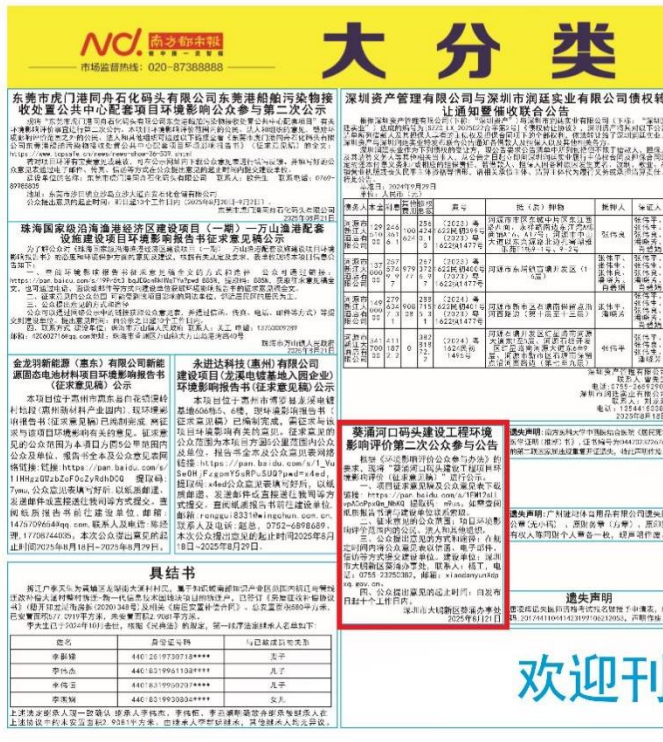
图 3.1-2 2025 年 8 月 21 日征求意见稿公示报纸截图

通过建设项目所在地公众易于接触的报纸南方都市报于2025年8月21日和8月27日两次发布了本项目环境影响评价征求意见稿，报纸截图见图3.1-2、图3.1-3。