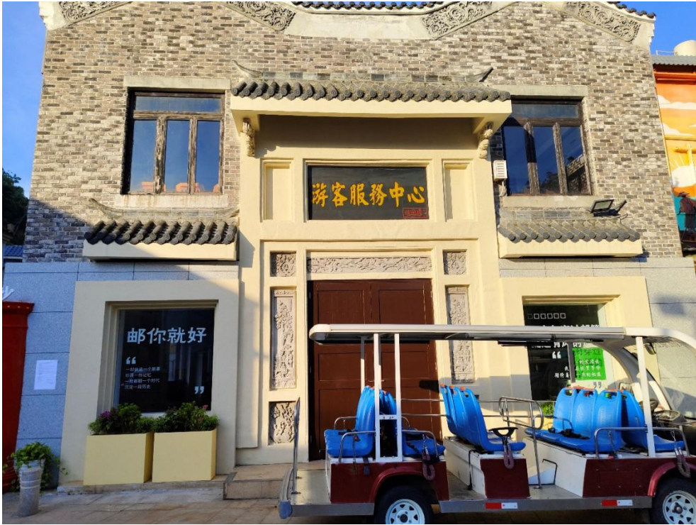
3. 沙鱼涌游客服务中心